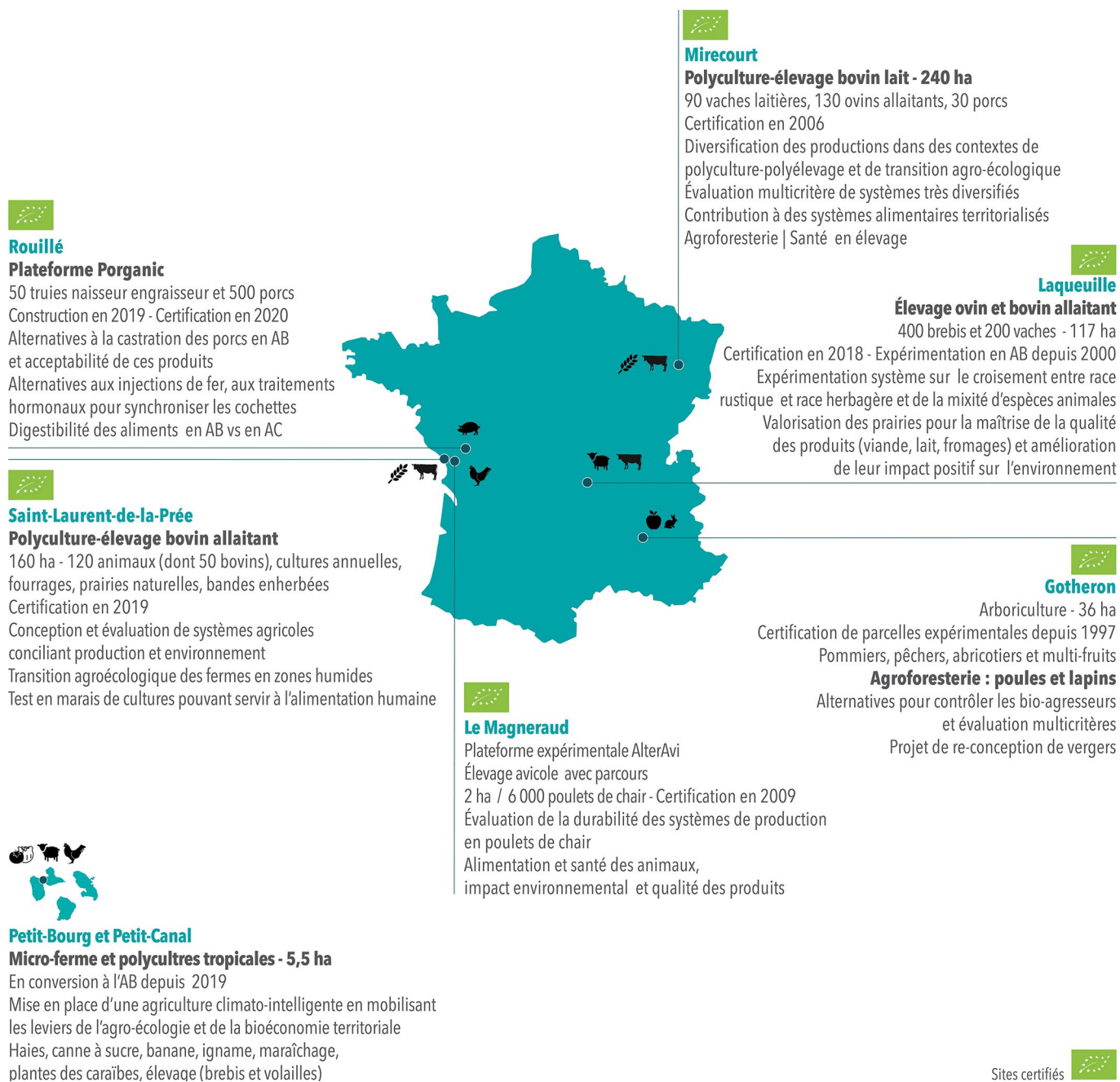
Figure 3. Les élevages bio dans les infrastructures expérimentales d'INRAE.

biologique entrée en application depuis janvier 2022, par F. Médale et S. Penvern ;