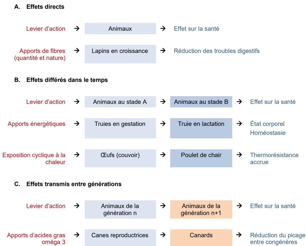
Figure 3. Temporalité d'action des leviers agissant sur la santé animale : effets directs (A), effets différés (B), effets transmis entre générations (C).

de la principale maladie respiratoire chez les femelles (Coudert et al. , 1999). De plus, pour gérer la pasteurellose chez les lapines reproductrices (formes respiratoire et abcédative), la maîtrise des conditions d'ambiance (température, hygrométrie et vitesse de l'air) est conjuguée à l'élimination des animaux présentant des signes cliniques pour prévenir la diffusion au sein de l'atelier élevage. La sélection d'animaux résistants à cet agent pathogène très problématique est possible (Shrestha et al. , 2020), mais reste à déployer dans les centres de sélection.