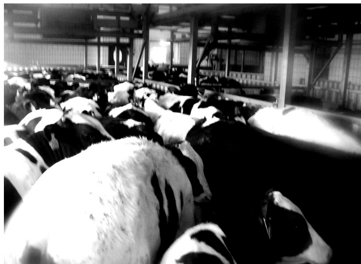
Photo 2 : A l'abattoir, les veaux de boucherie sont hébergés en groupe jusqu'à l'abattage.

Les différentes méthodes d'étourdissement présentent différents avantages