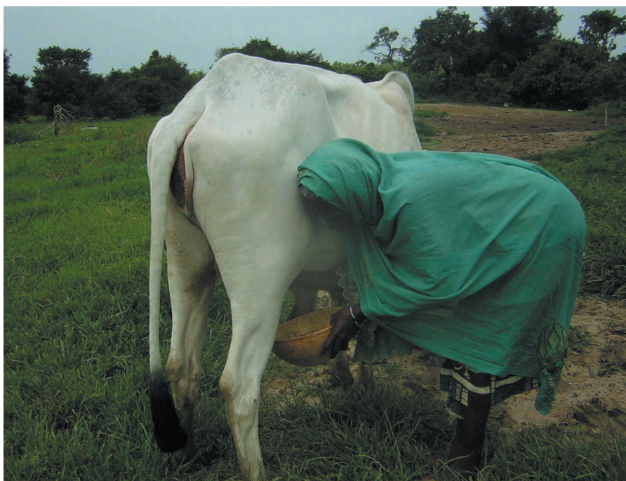
Photo 3. Elevage laitier au Nigeria.

Ces exemples montrent comment l'élevage participe à plusieurs dimensions spatiales des enjeux de sécurité