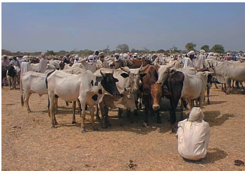
Photo 2. Marché de Roro au Sud-Est du Tchad.